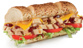
Pit de Pollastre