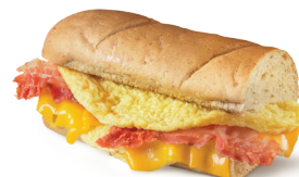
Sub ® Truita i Bacó o Pernil