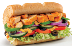
*Pollastre al Curri