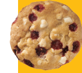
Cookie de cheesecake de gerds