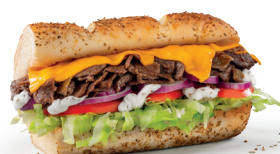
Bistec i Formatge