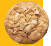
Cookie de xocolata blanca amb nous de macadàmia