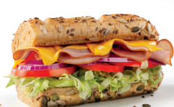
*Pernil i Formatge