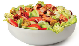
Amanida T.L.C. Teriyaki