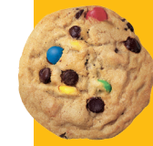
Cookie amb trossos de caramels de xocolata