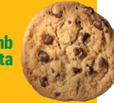
Cookie amb trossos de xocolata